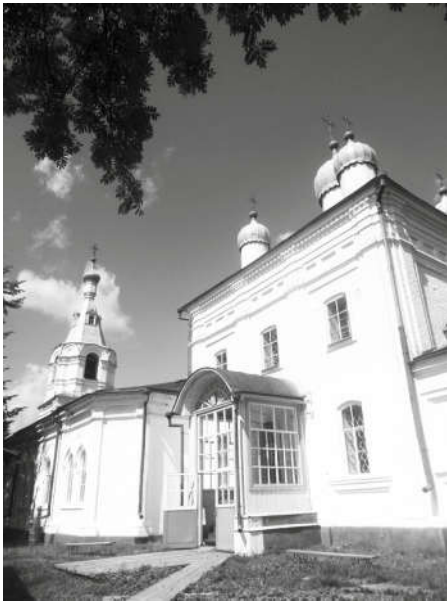
Покровский храм с. Падерино.