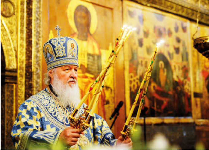
Святейший Патриарх Московский и всея Руси Кирилл.