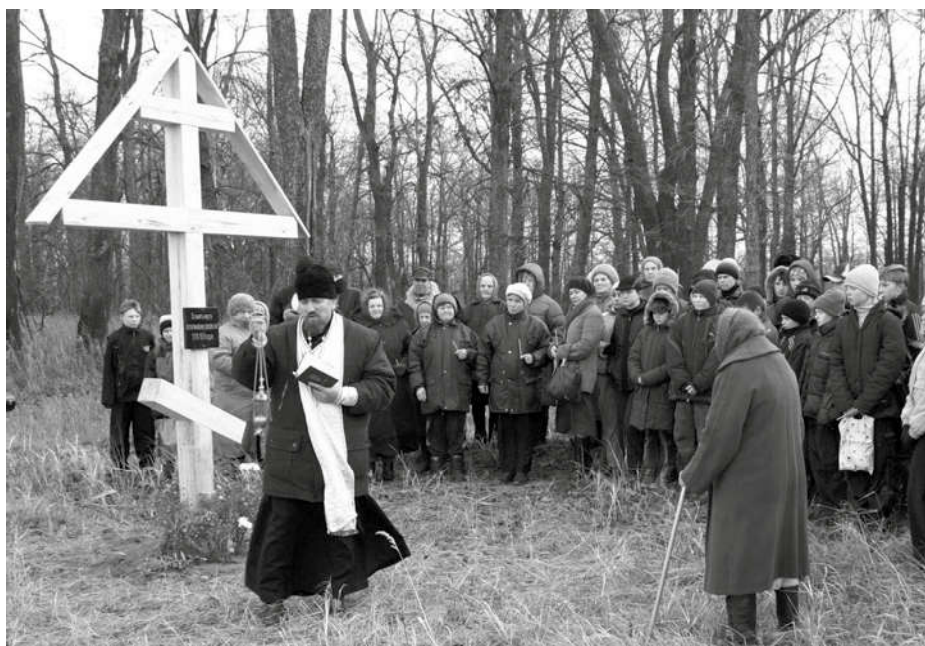
Освящение Поклонного креста на месте расстрелов

Местом массовых расстрелов стал левый берег Вятки напротив Котельнича. До недавнего времени там находили многочисленные человеческие кости. Осуждённых на расстрел вывозили на баржах, пароходе с названием «Практик». По рассказу местных жителей, корпус этого парохода до сих пор ле-