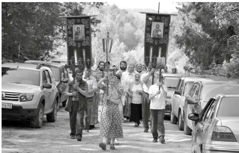
Крестный ход в день памяти преподобного Леонида Устьнедумского.

Вот и снова 30 июля. Природа пышет жаром вопреки совсем недавним прогнозам. Солнечный день, редкий для нынешнего лета. Сегодня праздник преподобного Леонида Устьнедумского — святого, приведшего наш край к вере, воздвигшего здесь Богу храм, создавшего обитель, ископавшего спасительную для неё речку Недуму. Речка эта не замерзает даже в лютые морозы, словно напоминающая о том, что надо жить с теплом в душе, с горячим сердцем, несмотря на любые жизненные испытания.