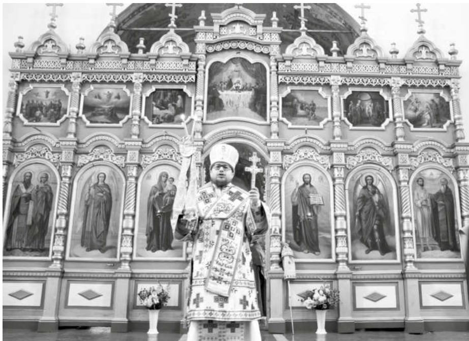
Архиерейское богослужение в Спасском храме с. Матвинур 29 августа 2017 г.

Душевный покой, прохлада, кругом чистота и порядок, неспешная, красивая служба, приятно потрескивают свечи. С икон на тебя смотрят лики святых, к которым обращаешься в горе и радости. Прихожан в храме довольно много, за долгие годы его посещения все стали друг другу родными и близкими. Кажется, что время здесь замедлило свой бег. Так идет сегодня приходская жизнь в храме Спаса Нерукотворного в селе Матвинур.